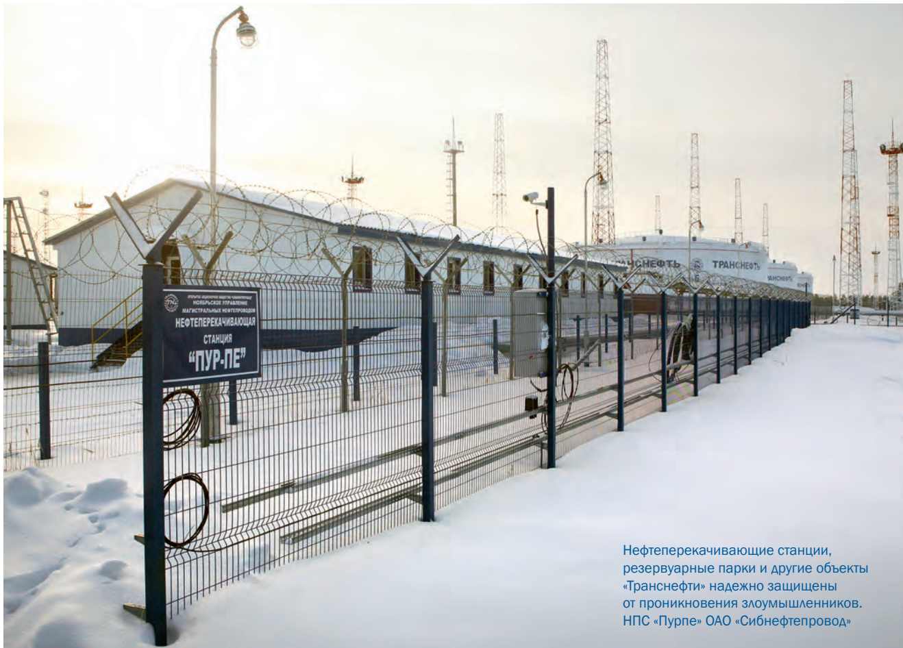
Нефтеперекачивающие станции, резервуарные парки и другие объекты «Транснефти» надежно защищены от проникновения злоумышленников. НПС «Пурпе» ОАО «Сибнефтепровод»

|| Курс на техническое перевооружение систем безопасности определен руководством компании. Акцент в этой области делается на повышении качественного уровня, внедрении инновационных решений и технологий. Наряду с отказом от технически и морально устаревших систем ведется активный мониторинг отечественных и зарубежных средств охраны, позволяющих эффективно предупреждать и пресекать любые преступные посягательства